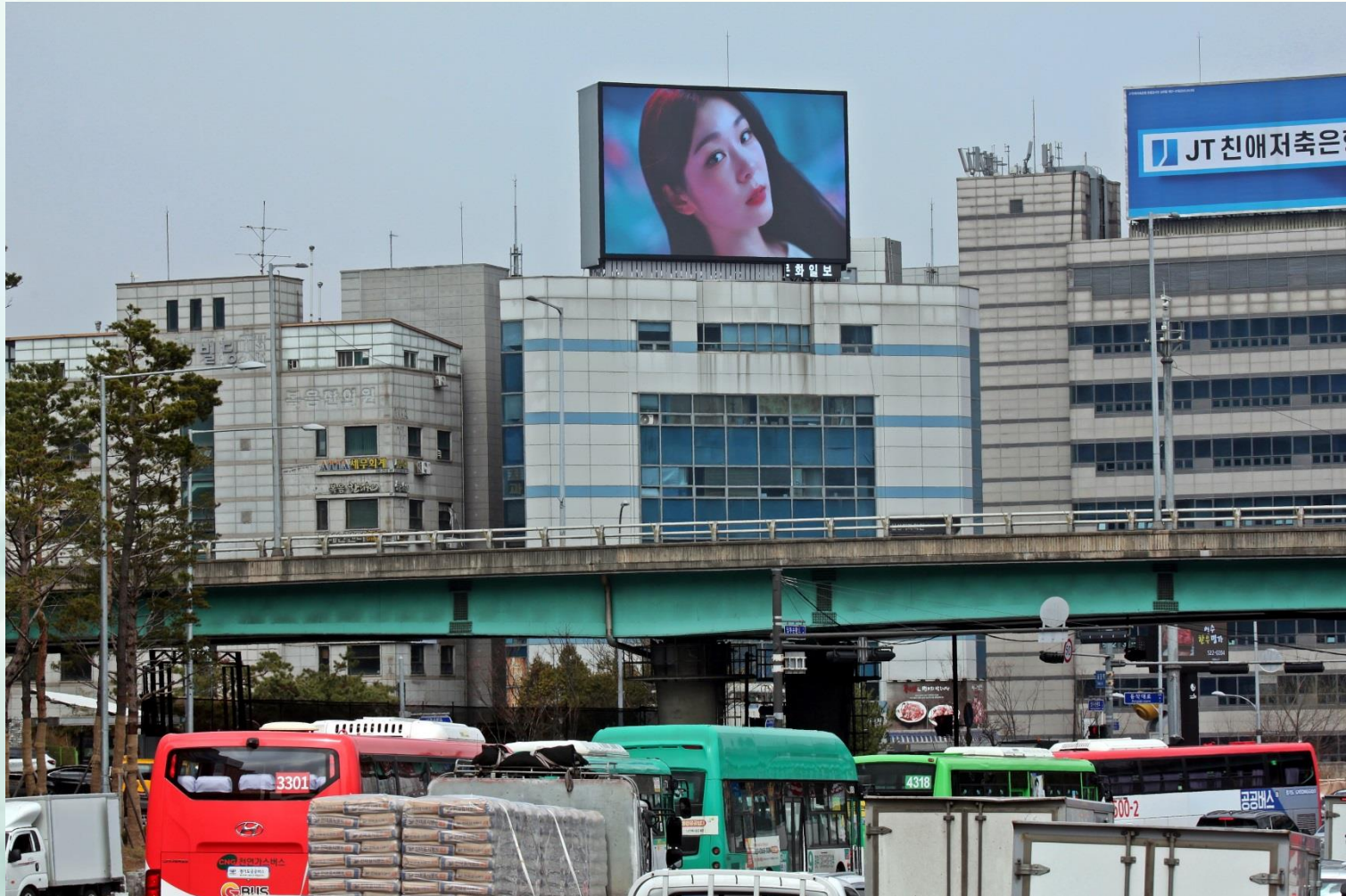
사당역 사거리 전광판