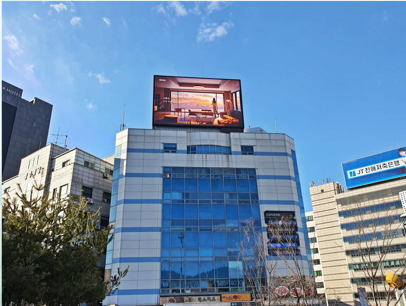
사당역 사거리 전광판