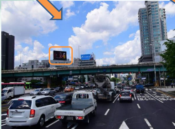
과천에서 이수교 방향으로